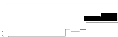
lokalizacja apartamentu na kondygnacji: